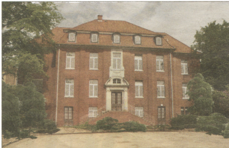
Die ehemalige Pathologie war bis 2006 Teil des AK Barmbek, das aus einzelnen kleinen Pavillons bestand.